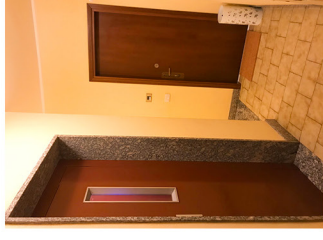
First Floor Primo Piano