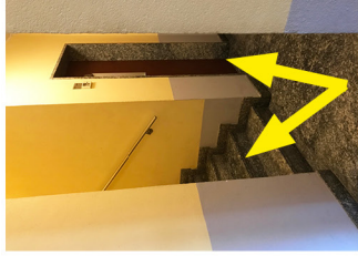
Stairs or lift Scale o ascensore