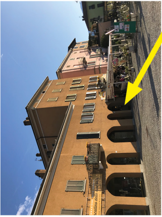
The entrance to the building / L'ingresso del palazzo