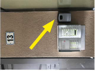
Safe Box with keys Cassetta con chiavi