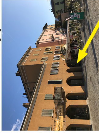
The entrance to the building / L'ingresso del palazzo