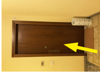
The entrance L'ingresso