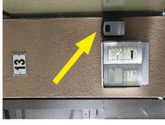
Safe Box with keys Cassetta con chiavi