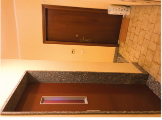
First Floor Primo Piano