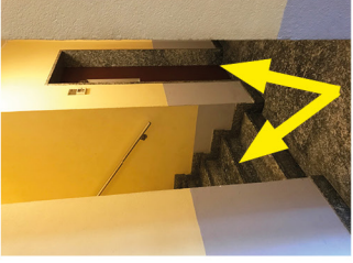
Stairs or lift Scale o ascensore